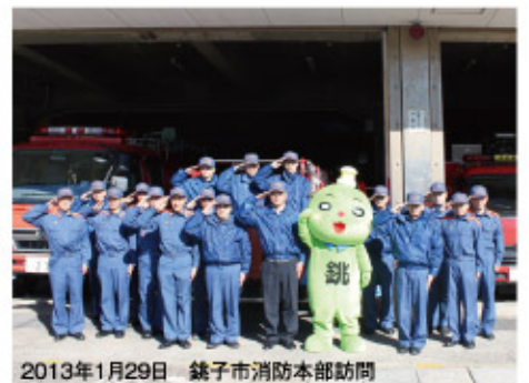
2013年1月29日 銚子市消防本部訪問