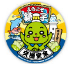
交通安全ステッカー

只今ちょーぴーグッズは、マスコットキーホルダーとシールを市内の土産物販売店及び観光施設にて販売しており、大好評を頂いております。今後も続々と新たなグッズを作成してまいりますので、是非ご購入して頂けたらと思います。