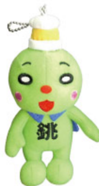
マスコットキーホルダー