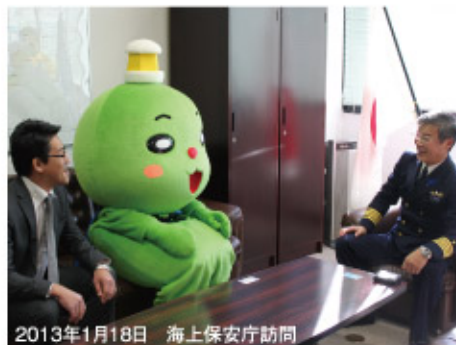
2013年1月18日 海上保安庁訪問