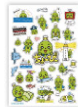
カッティングシール