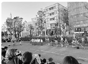
▲出演団体によるパフォーマンス①