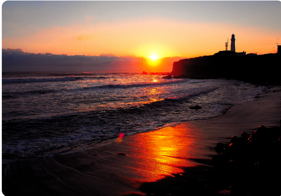
▲日本一早い初日の出