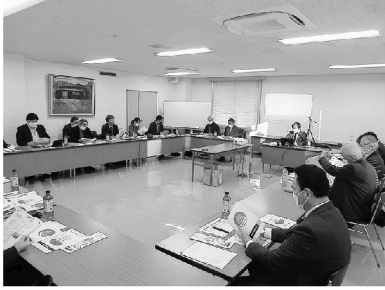
▲熱心に協議する出席者

会議では、パシフィックコンサルタンツ(株)・小野崎技術リーダーより「実施主体は銚子市観光協会となり、連携団体と役割分担は、銚子市(関係課調整・事業全体監修)、銚子商工会議所(R2年度誘客多角化事業の成果・感染対策等のノウハウの提供)、ジオパーク推進協議会・千葉科学大学・銚子商業高校)ガイド及びファシリテーター(育成)、銚子電鉄(外川駅