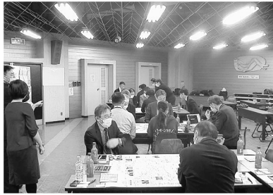
▲グループ毎に意見を出し合う出席者

そうした中、観光拠点の再生に向けて観光分野の事業者である（一社）銚子市観光協会とタクシーの交通事業者及び市・商工会議所が昨年に引き続き、観光事業において課題である二次交通について様々な取り組みを行っており、今回、域内における二次交通の在り方及び全国的に実証しているMaasを市内への導入についての可能性について協議する第1回プロジェクト会議を12月10日（金）午後3時から銚子市役所市民ホールにて開催し、市内関係団体・会社等16名とコンサルタント会社7名の計23名が出席した。