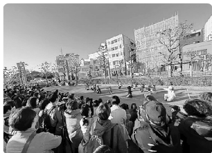
▲出演団体によるパフォーマンス②