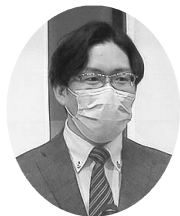
林衆議院議員 (山野秘書)