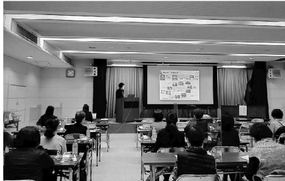
配信会場の成田商工会議所