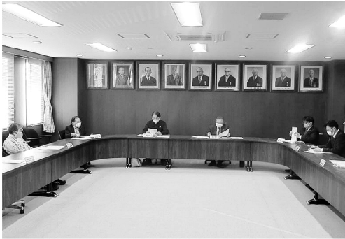
▲熱心に協議する出席者

次の「②」当所議員視察研修会の実施概要」では、新型コロナウイルス感染症状況を見ながら実施することを前提として、洋上風力やゼロカーボンシティを取り組んでいる地域(秋田県能代市・長崎県五島市・静岡県浜松市)を候補地として、本年5月頃に実施出来るよう視察先との事前交渉及び詳細資料を1月下旬迄に収集し、早速、最終判断前の準備を整えることになった。