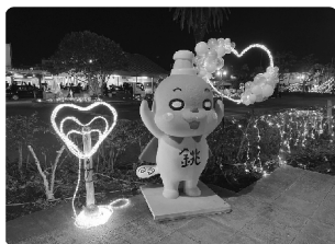
▲昨年から好評フォトスポット

本年度も約10万球のイルミネーションで駅前を装飾し、昨年好評だった飾り付けをベラスに光量等のパワーアップ、一部箇所の変更を行い、銚子の駅前を彩る。