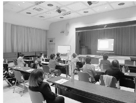
▲当所大ホールにて視聴する参加者

ンドハンドリング、成田空港支店業務部長、本社空港企画部教育訓練統括マネジャー、空港オペレーション教育訓練部長などを経て2021年4月 成田空港支店長に就任。会社人生37年のうち20年を成田空港で過ごす。