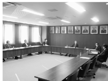
▲熱心に協議する出席者

係者から視察する場所・懇談内容をはじめ宿泊先・食事・交通機関等を手配して欲しいとの希望を確認しており、その内容を取りまとめた資料を元に協議した。結果、初日（1/17）と最終日（1/19）は移動日となる為、銚子・羽田空港間の送迎を交通事業者に依頼して大型バス1台の手配及び添乗としてCICOWS（株）関係者が数名乗車することになった。また、宿泊については、宿泊事業者に依頼して、2泊共一室1名が泊まれる宿泊施設を予約することになった。メインの視察日（1/18）としては、CICOWS（株）及び発電事業者が同行して、午前中に洋上風車設置エリアが一望できる銚子の丸く見える丘展望館からの説明と乗船して現在1基稼働している風車と促進区域を海上視察。昼食を挟んで午後からは商工会議所にて、行政及びCICOWS（株）との意見交換会・発電事業者による講演会全て長崎県杵岐市地元にいる方も含めたハイブリッド形式開催。移動手段は、交通事業者に依頼して大型バス1台の手配及び添乗としてCICOWS（株）関係者が数名乗車。食事は、観光協会から予約して頂く事になった。今回、視察受け入れ第1号でもあるので、当協議会が一丸となって対応し、視察来訪者から「銚子の視察は良かったね」と他にPRして頂けるよう、今春の本格始動に向けてのトレーニングも兼ねて万全を期して準備を進めることを確認した。