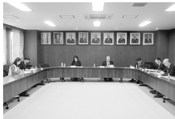
▲協議する委員各位