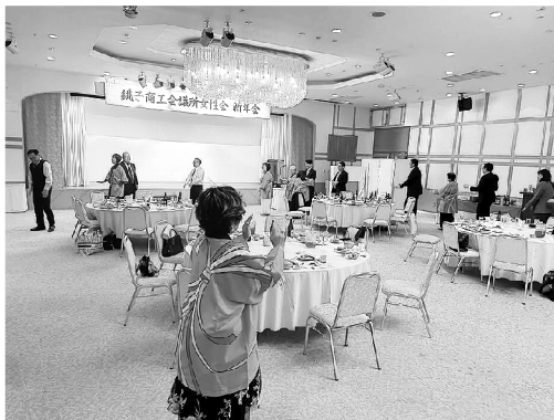
▲恒例の大漁節を踊る皆さん