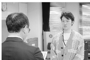
▲修了証を受ける受講者代表

その後、受講生代表より創業に向けた抱負が語られ、続いて、今回のスクール開催に全面的に協力して頂いた地域創業支援者である銚子市・TKC千葉会・日本政策金融公庫千葉支店・銚子信用金庫・銚子商工信用組合より、それぞれスクール全体の総評と受講生に対するエールが送られ、全日程を終了した。