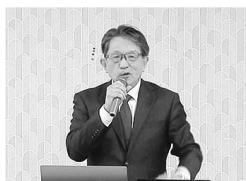
▲鯉沼エリアコーディネーター(引継支援センター)