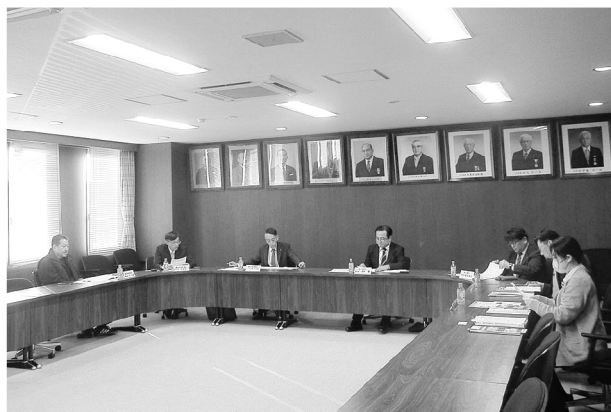
▲協議する委員各位