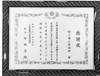
▲銚子警察署からの感謝状