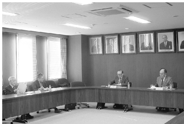
▲協議する委員各位