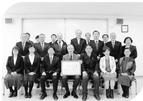
▲出席者による記念撮影