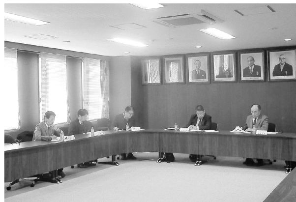
▲協議する委員各位