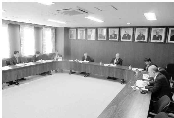
▲協議する委員各位