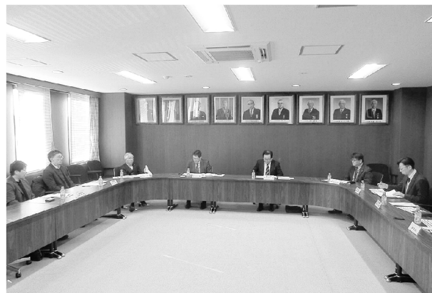
▲協議する委員各位