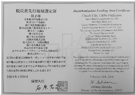
▲脱炭素先行地域選定証

や経済を循環し、豊かさを作る取組であるという意識を広めて頂きたい」と閉会挨拶があり、その後、地域毎の写真撮影が行われ、閉会した。