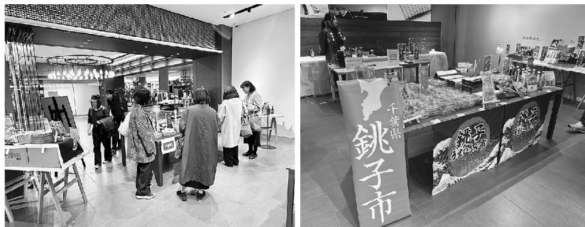
▲展示スペースの様子

今回のポップアップストアは、銚子ブランド推奨品認定事業の認知度向上と登録商品の販路拡大を目的として、三菱食品株式会社の協力のもと実施した。当日は、近隣オフィスの従業員や地域住民を中心に多くの来店があった。