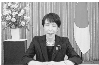
▲来賓祝辞を述べる高市首相

次の『表彰』では、「日本商工会議所表彰」として、特別功労表彰、役員・議員及び職員表彰、商工会議所表彰がそれぞれ行われた。次の『総会議事』では、「変革と価値共創による中小企業・小規模事業者の稼ぐ力の強化」・「地域の稼ぐ力の向上による地域経済循環の推進」・「地域の中核を担う商工会議所の機能強化」等の『2026年度事業計画(案)』及び総額26億5606万円(前年度比5億921万円増)の『同収支予算(案)』が異議なく承認された。