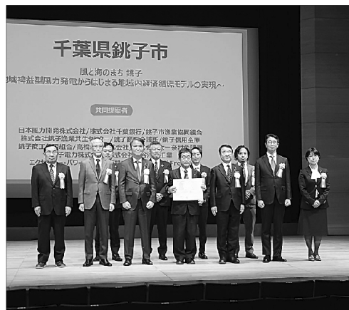
▲銚子市及び共同提案者

2030年度までにカーボンニュートラルを実現する全国モデルとなる脱炭素先行地域〔第7回募集〕において、当市を含む全国12地域が環境省より選定され、「選定証授与式」が本年2月26日(木)午後5時30分より都内・有楽町朝日ホールにて行われ、当市から行政をはじめ共同提案者である当所(岡田顧問)を含め21名が出席した。 当日は、最初に石原環境大臣が「2050年のカーボンニュートラル実現には、地域の強みを生かした地方創生に資する地域脱炭素の取組が重要であり、今回選定された地域の皆さんは創意工夫に富んだ素晴らしい提案でした」。脱炭素先行地域評価委員会の竹原座長(政策研究大学院大学教授)が「今回の12地域の提案は、先進性・モデル性の観点でそれぞれ際立った特徴を有しており、とりわけ、地域脱炭素の取組を通じて達成を目指す地域課題解決・地方創生のテーマや地域にもたらされる具体的な裨益が明確に示された提案が選定に至った」とそれぞれ選定理由を含めた挨拶があり、続いて、石原大臣から全国12地域の代表者に選定証の授与が行われた。 最後に、青山環境副大臣から「各地域の取組が未来の為の投資であり、地域でエネルギー