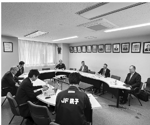
▲熱心に審議する取締役・監査役

「議案第3号Ⅱ第7期経営計画(案)」では、経営環境(外部環境+当社の歩むべき道)や3ヶ年計画(令和8～10年度の事業方針・設備等の方針・財務方針)を踏まえ、第7期(令和8年度)の事業計画(案)「I. メンテナンス事業、II. 視察受け入れ事業」及び収支予算(案)〔総額11596万円〕を承認し、午後5時に閉会した。