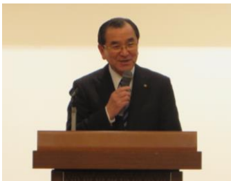
▲祝辞を述べる宮内会頭