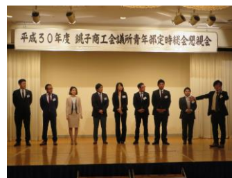
▲新役員を紹介する関根会長