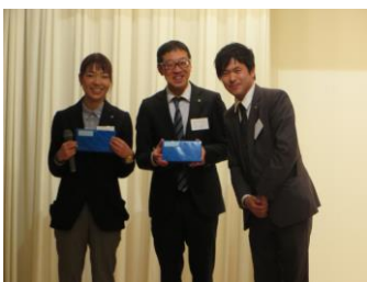
▲会員奨励者二名と表彰する荒田会長